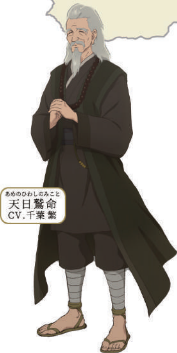
あめのひわしのみこと 天日鷲命 CV.千葉繁