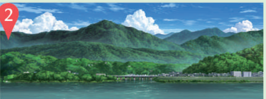
吉野川対岸の瀬詰大橋付近からの高越山。国道192号線を走ると綺麗な阿波富士の形が見える。

車で行けるのは高越寺の駐車場まで。そこから山頂までは徒歩約30分の道のり。道幅が狭く山道に慣れていない人は注意が必要。大型車は不可。遠方から阿波富士と呼ばれる高越山を眺めるのもお勧め。