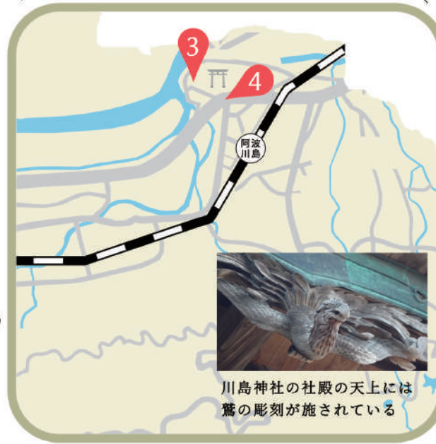
川島神社の社殿の天上には鷲の彫刻が施されている