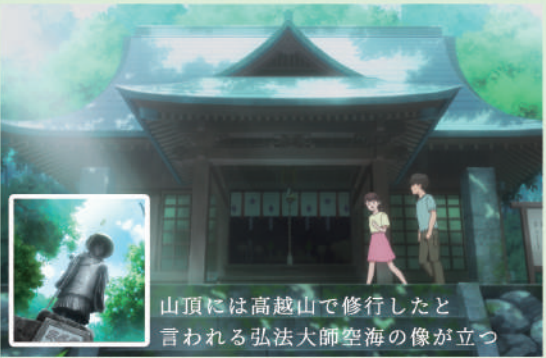
山頂には高越山で修行したと言われる弘法大師空海の像が立つ

高越山は標高1,133m。高越山山頂付近に高越寺があり、さらに参道を登ると高越神社がある。高越神社の御祭神は天日鷲命(あめのひわしのみこと)。映画では竜介と知美に霊界探訪の試練を与える。